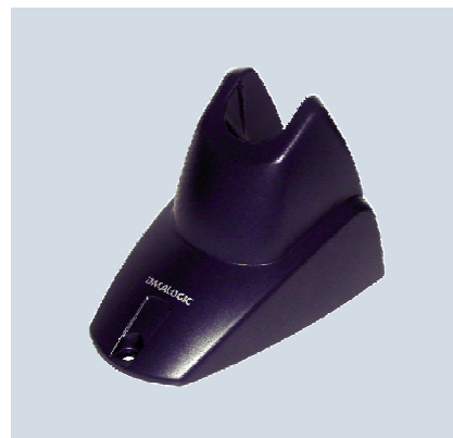
Supporto STD Heron™ "Hands-Free" con piastra metallica opzionale